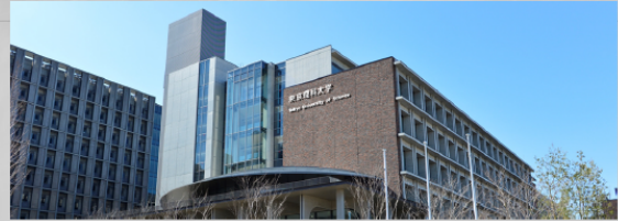
東京理科大学葛飾キャンパス

公共の交通機関をご利用いただくか、周辺の コインパーキングなどをご利用ください。